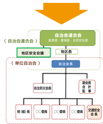
【今後の組織のイメージ図】

自治会連合会では、交流センターを活動拠点とした地域組織（仮称）地域づくり協議会」の取組みを推進しています。 地域では、従来より様々な団体が活発な活動をされています。しかし、似たような活動が多かったり、またそれぞれの団体の総会や会議に自治会役員が出席することが多くなったり負担が大きくなり、結果、