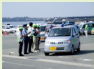
地域防犯活動を推進

●各地区で地区安全会議が設立されつつあり、地域の防犯活動が活性化している中、静岡県警より感謝状を頂きました。