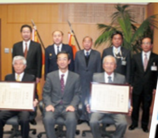
静岡県警本部から感謝状授与