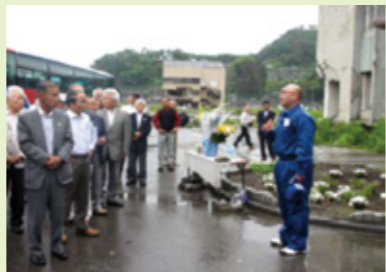
東日本大震災被災地視察

●各地区で地区安全会議が設立されつつあり、地域の防犯活動が活性化している中、静岡県警より感謝状を頂きました。