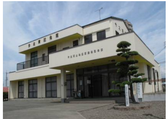
今之浦地区まちづくり協議会・活動拠点

今、地域に求められている、「地域づくり協議会」は、当面「今之浦地区まちづくり協議会」で対応することにしました。